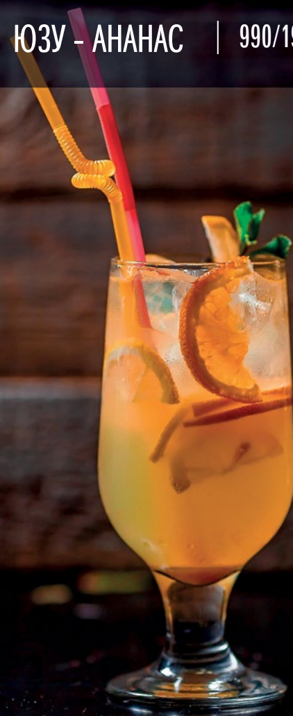
• ЮЗУ - АНАНАС | 990/1990 ТГ

пюре манго, пюре маракуйя, сиропы манго-маракуйя, содовая, лимон | 990/1990 ТГ