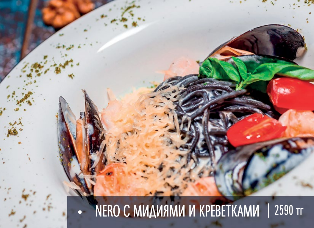
• НЕРО С МИДИЯМИ И КРЕВЕТКАМИ | 2590 тг