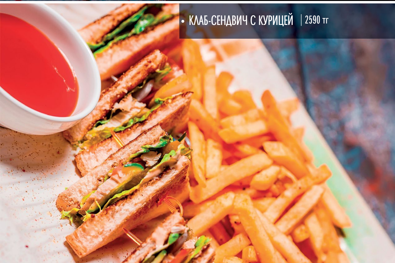
• КЛАБ-СЕНДВИЧ С КУРИЦЕЙ | 2590 тг