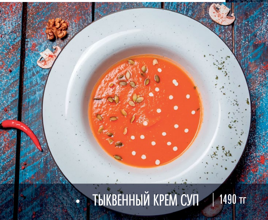
• ТЫКВЕННЫЙ КРЕМ СУП | 1490 тг