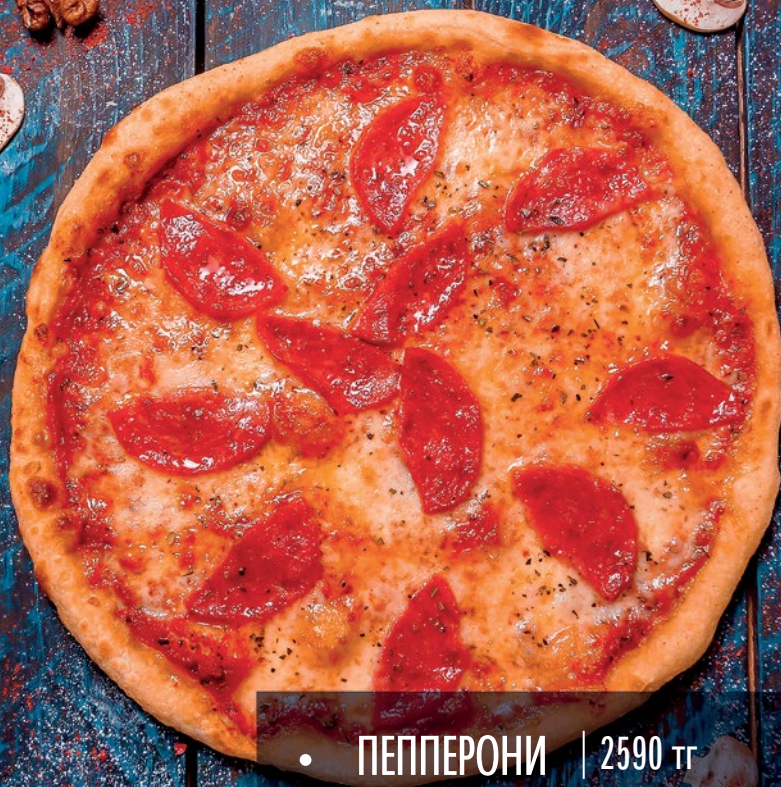
• ПЕППЕРОНИ | 2590 тг