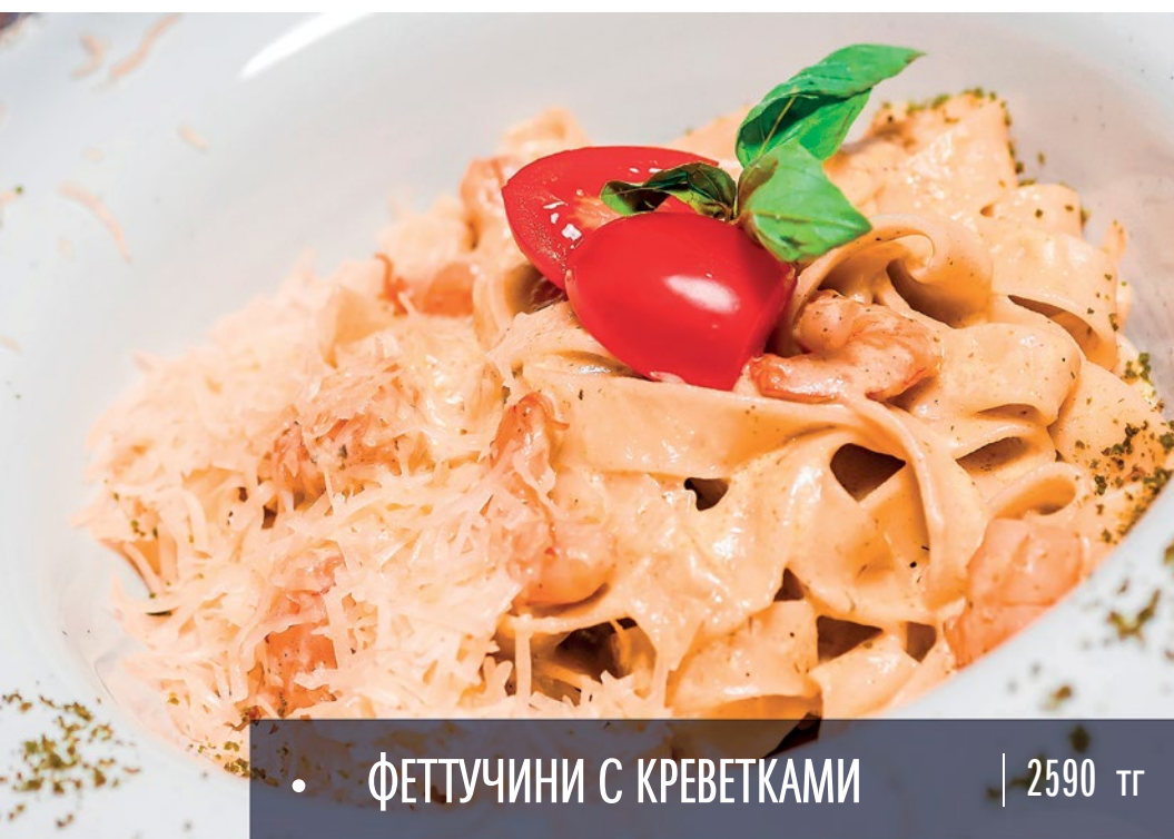
• ФЕТТУЧИНИ С КРЕВЕТКАМИ | 2590 тг