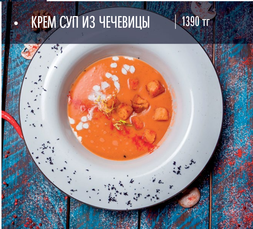
• КРЕМ СУП ИЗ ЧЕЧЕВИЦЫ | 1390 тг