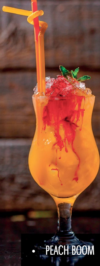
• PEACH BOOM | 1490 ТГ