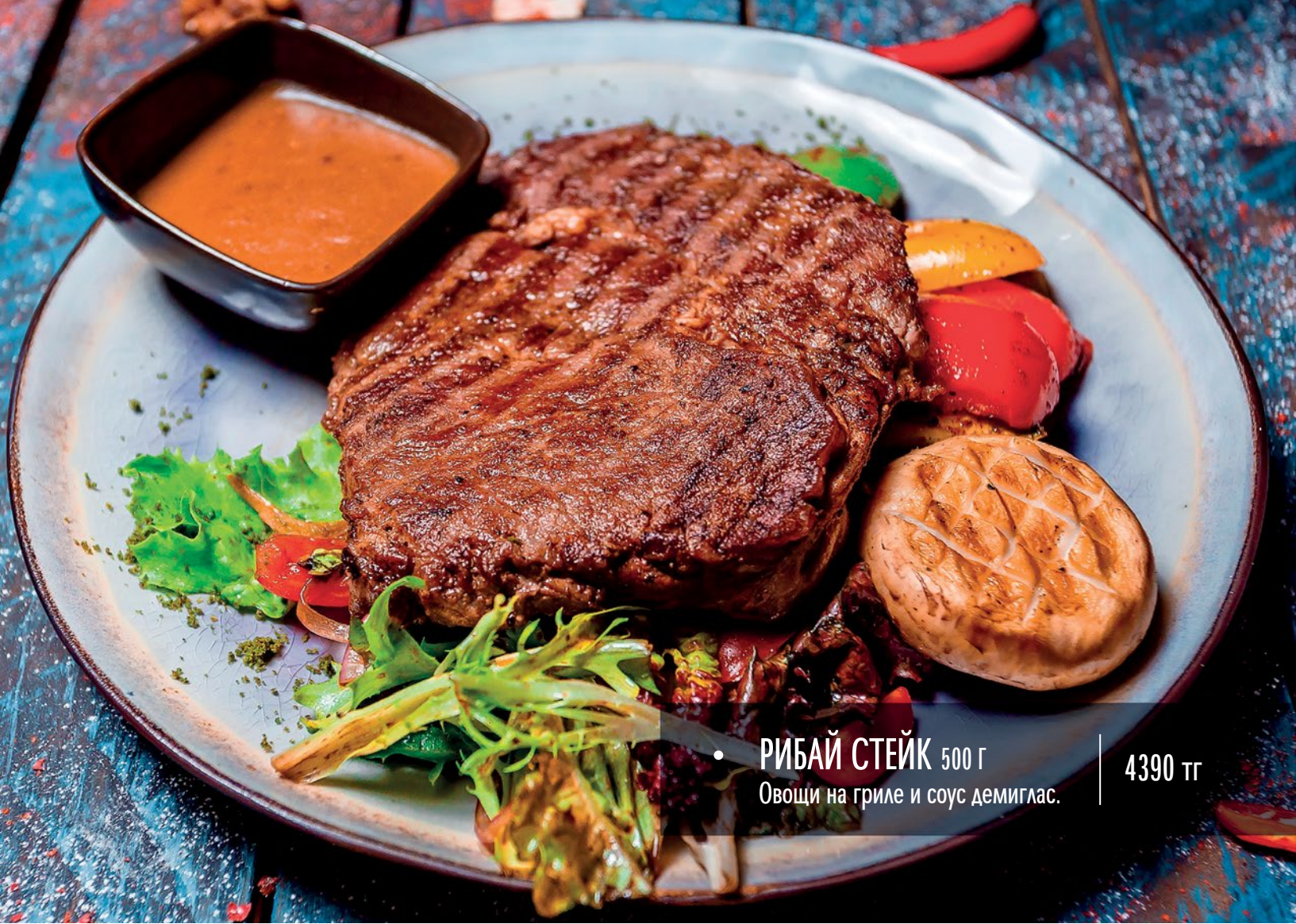
• РИБАЙ СТЕЙК 500 Г Овоци на гриле и соус демиглас.