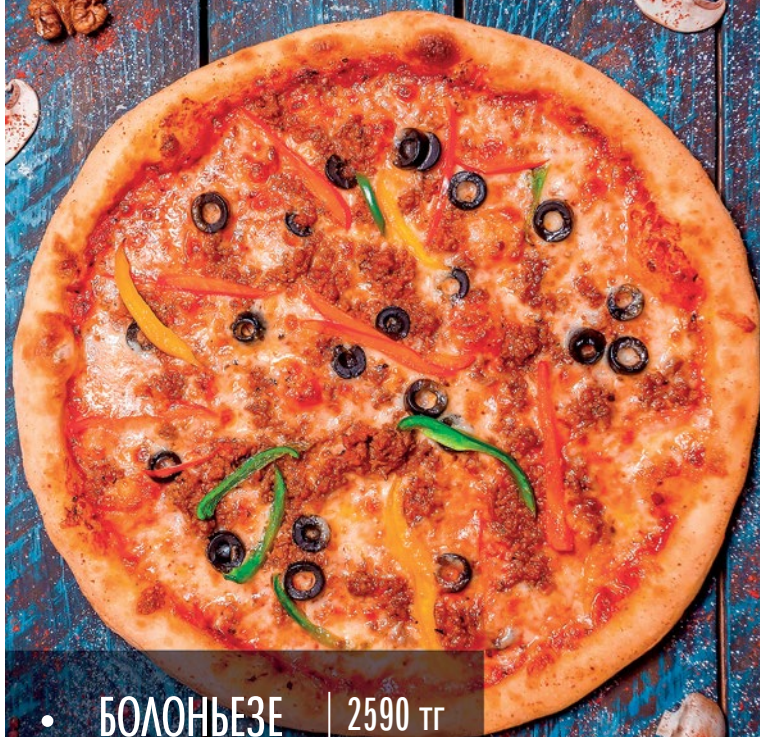
• БОЛОНЬЕЗЕ | 2590 тг