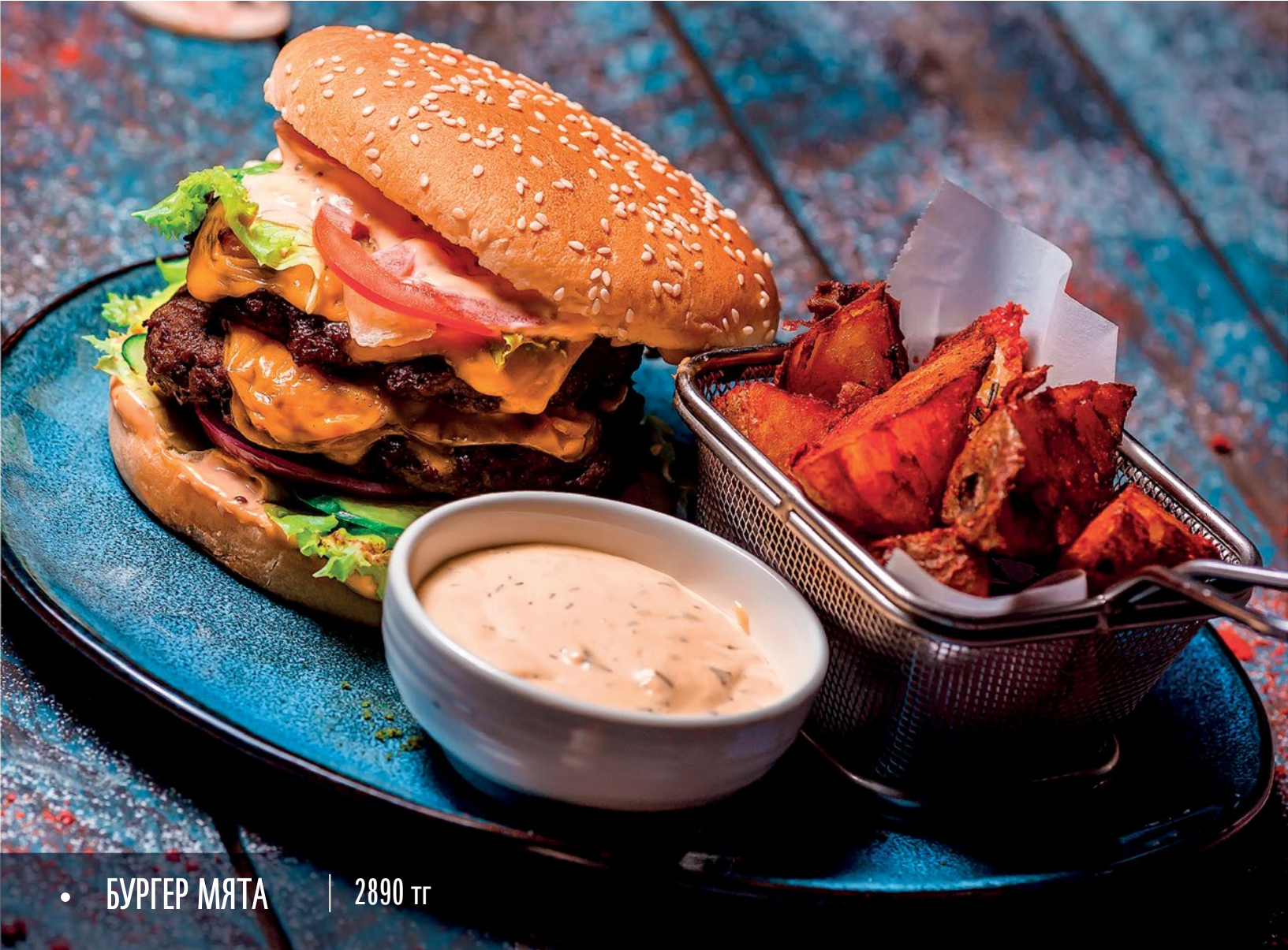
• БУРГЕР МЯТА | 2890 тг