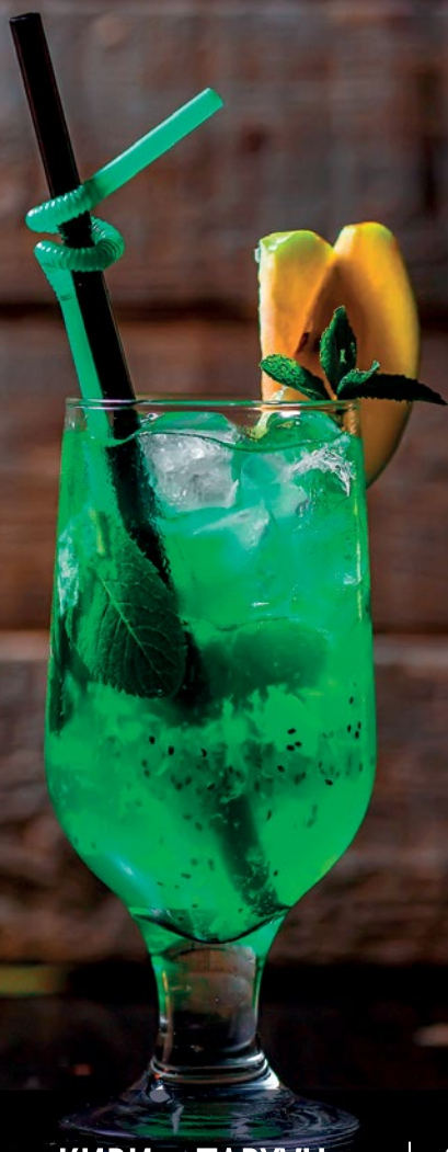
• КИВИ - ТАРХУН | 990/1990 ТГ