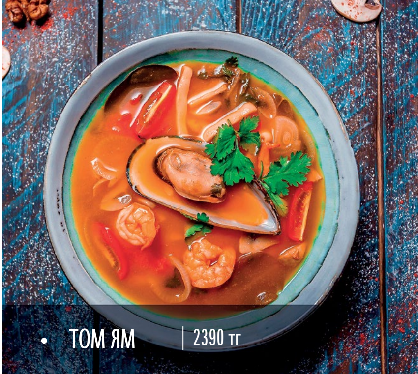
• ТОМ ЯМ | 2390 тг