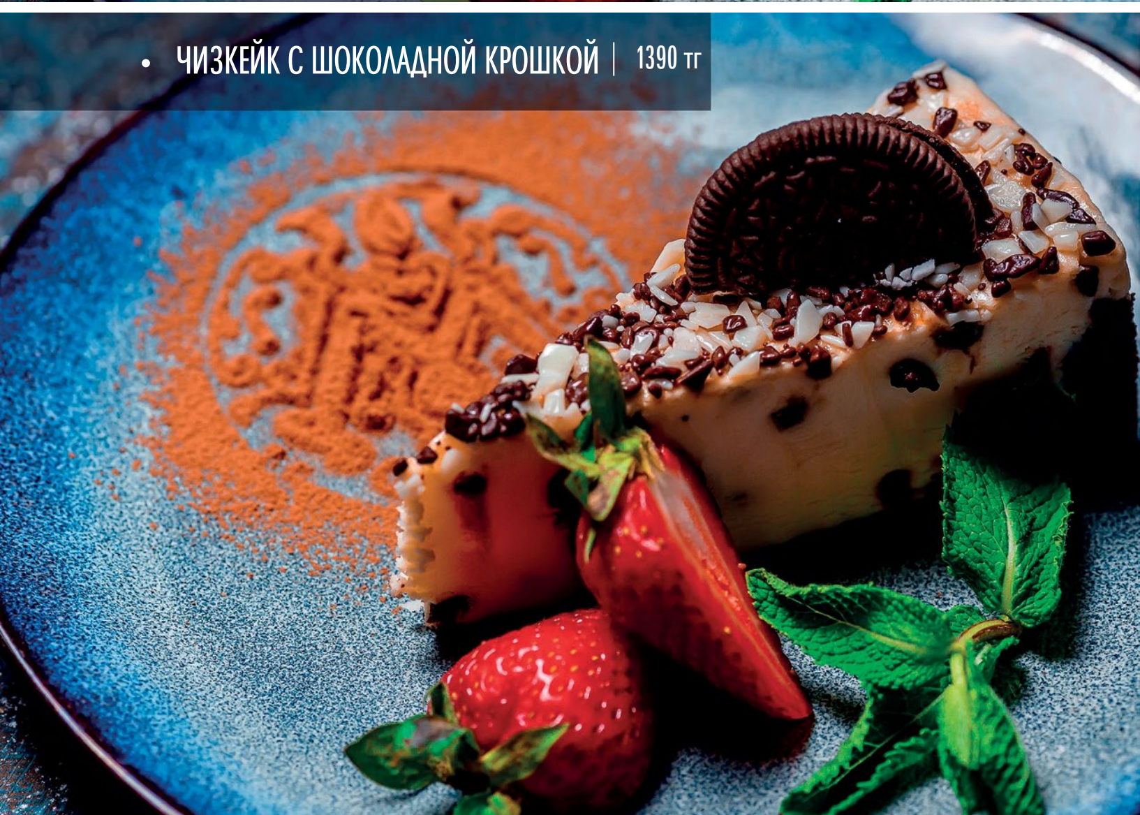
• ЧИЗКЕЙК С ШОКОЛАДНОЙ КРОШКОЙ | 1390 ТГ