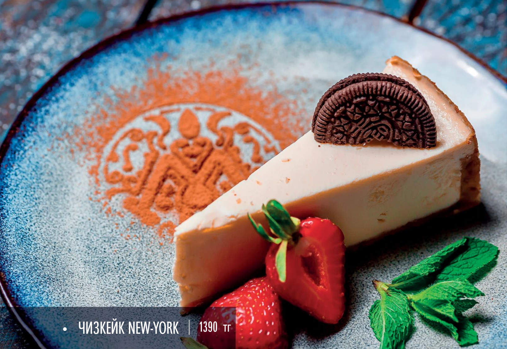
• ЧИЗКЕЙК NEW-YORK | 1390 ТГ