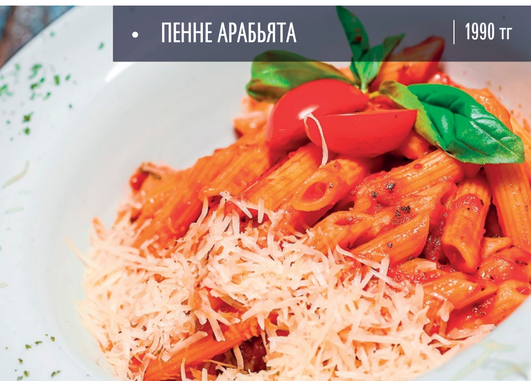
• ПЕННЕ АРАБЬЯТА | 1990 тг